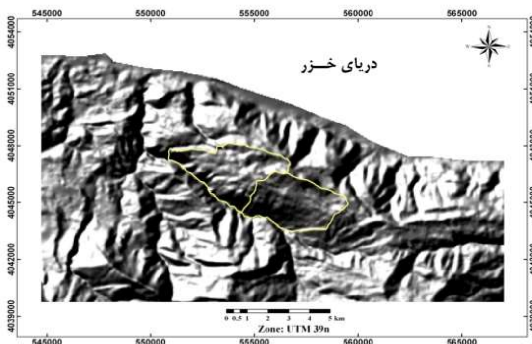
شکل ۱: موقعیت منطقه مورد مطالعه در نقشه پستی و بلندی منطقه

در این تحقیق از داده‌های سنجنده TM ماهواره لندست ۵ به شماره‌گذر ۱۶۵ و ردیف ۳۵ مربوط به تاریخ ۲۰ مرداد ماه سال ۱۳۹۰ هجری شمسی (۱۱ آگوست ۲۰۱۱ میلادی) و از نقشه‌های دو بعدی (2D) برای کنترل کیفیت هندسه تصاویر ماهواره‌ای استفاده شد. برای تجزیه و تحلیل رقومی، پردازش تصاویر ماهواره‌ای، از نرم‌افزار Idrisi Taiga برای استخراج مختصات قطعات نمونه برداشت شده از نرم‌افزار MapSource، برای طراحی و انطباق قطعات نمونه و قرائت نقشه‌ها از نرم‌افزار ArcGIS 9.3 و Arcview3.2a، برای تجزیه و تحلیل آماری داده‌ها و رسم نمودارها از نرم‌افزارهای Microsoft Excel و SPSS Ver20 استفاده شد.